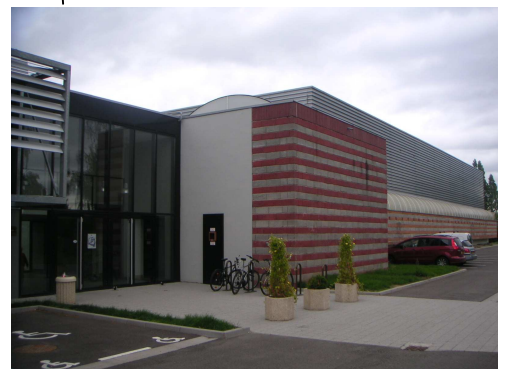
Hall des Sports « le chêne », 1 rue du stade

Le gymnase se situe le long de la ligne B du tram entre la station "Général De Gaulle" et le terminus "Hoenheim Gare". Horaires et plans : http://www.cts-strasbourg.fr/